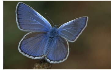
Slika 3: Navadni modrin

Spada v družino modrinov (Lycaenidae). Modrini so majhni metulji z zelo značilnim vzorcem ali risbo na spodnji strani kril. Samci in samice so različno obarvani. Medtem ko ima samec barvo kril modro z ozkim črnim robom in belimi resicami, je samica rjava z oranžnimi robnimi pegami. Modrini so pri nas zelo razširjeni in jih najdemo tudi nad 2000 m visoko.