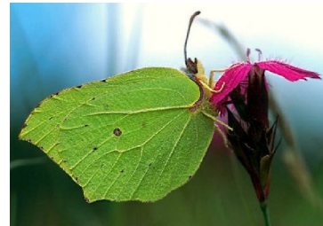
Slika 5: Citronček

Citronček ali rumenjaka spada v družino belinov (Pieridae). To so srednje veliki dnevni metulji, ki so dokaj pogosti na gozdnem in grmovnatem svetu. Krila so pri samcih citronsko rumena, pri samicah pa zelenkasto bela. Tako samec kot samica imata na sredini obeh krilih oranžno pegico. Medtem, ko prezimi večina metuljev kot buba, se citronček obesi na vejo kot metulj. Velja za enega najbolj dolgo živečih metuljev.