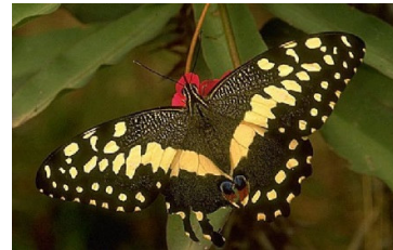
Slika 4: Lastovičar počiva

Lastovičar spada v družino jadrancev (Papilionidae). To je naš največji in tudi najlepši metulj. Rad obletava vzpetine in nemirno frfota ob cvetovih, ko srka medico. Osnovna barva kril je žvepleno rumena. Prednja krila imajo črne pege, zadnja krila pa imajo ob notranjem robu rdeče rjavo oko. Na zadnjem delu kril ima lastovičar kratek repek.